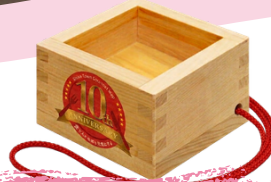
酒枡ストラッププレゼント ※画像はイメージです