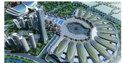
昆明滇池国際会展センター